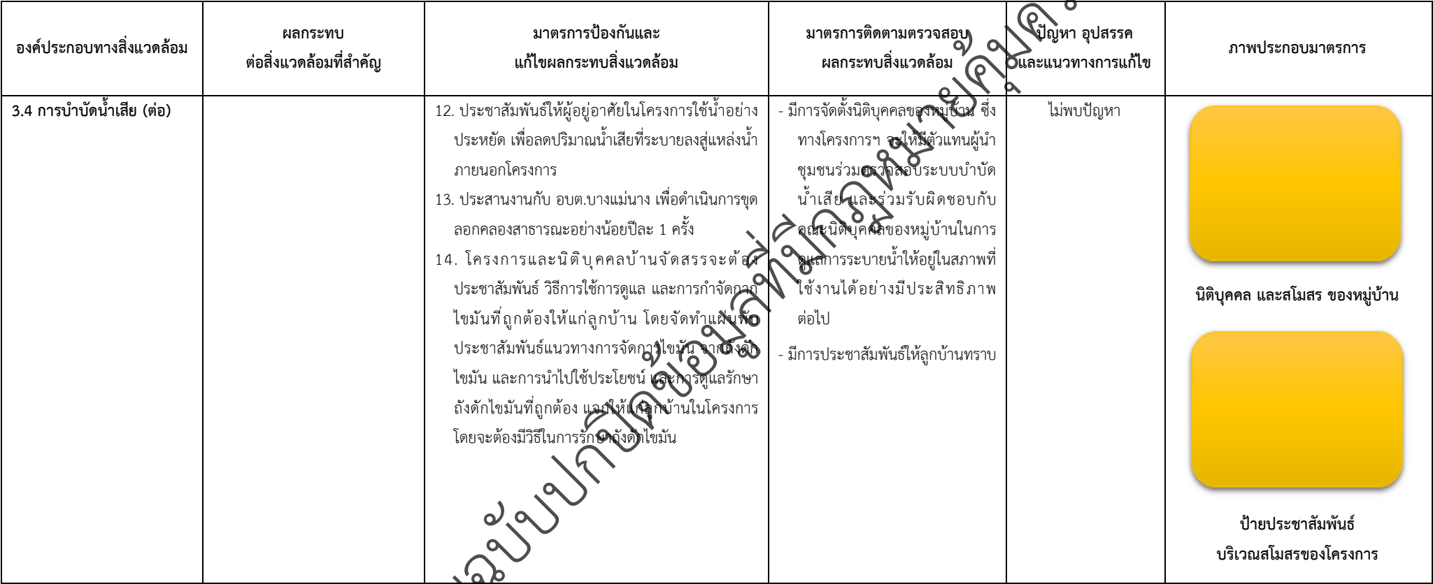
ตารางที่ 2-1 สรุปผลกระทบสิ่งแวดล้อมที่สำคัญและการปฏิบัติตามมาตรการป้องกันและแก้ไขผลกระทบสิ่งแวดล้อมและมาตรการติดตามตรวจสอบผลกระทบสิ่งแวดล้อม (ระยะดำเนินการ) โครงการจัดสรรที่ดิน เพอร์เฟค พาร์ค พระราม 5 - บางใหญ่ (โครงการต่อเนื่องในอนาคต) ตั้งอยู่ที่ ตำบลบางแม่นาง อำเภอบางใหญ่ จังหวัดนนทบุรี (ต่อ)