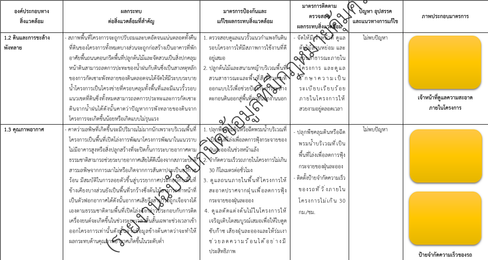
ตารางที่ 2-1 สรุปผลกระทบสิ่งแวดล้อมที่สำคัญและการปฏิบัติตามมาตรการป้องกันและแก้ไขผลกระทบสิ่งแวดล้อมและมาตรการติดตามตรวจสอบผลกระทบสิ่งแวดล้อม (ระยะดำเนินการ) โครงการจัดสรรที่ดิน เพอร์เฟค พาร์ค พระราม 5 - บางใหญ่ (โครงการต่อเนื่องในอนาคต) ตั้งอยู่ที่ ตำบลบางแม่นาง อำเภอนางใหญ่ จังหวัดนนทบุรี (ต่อ)