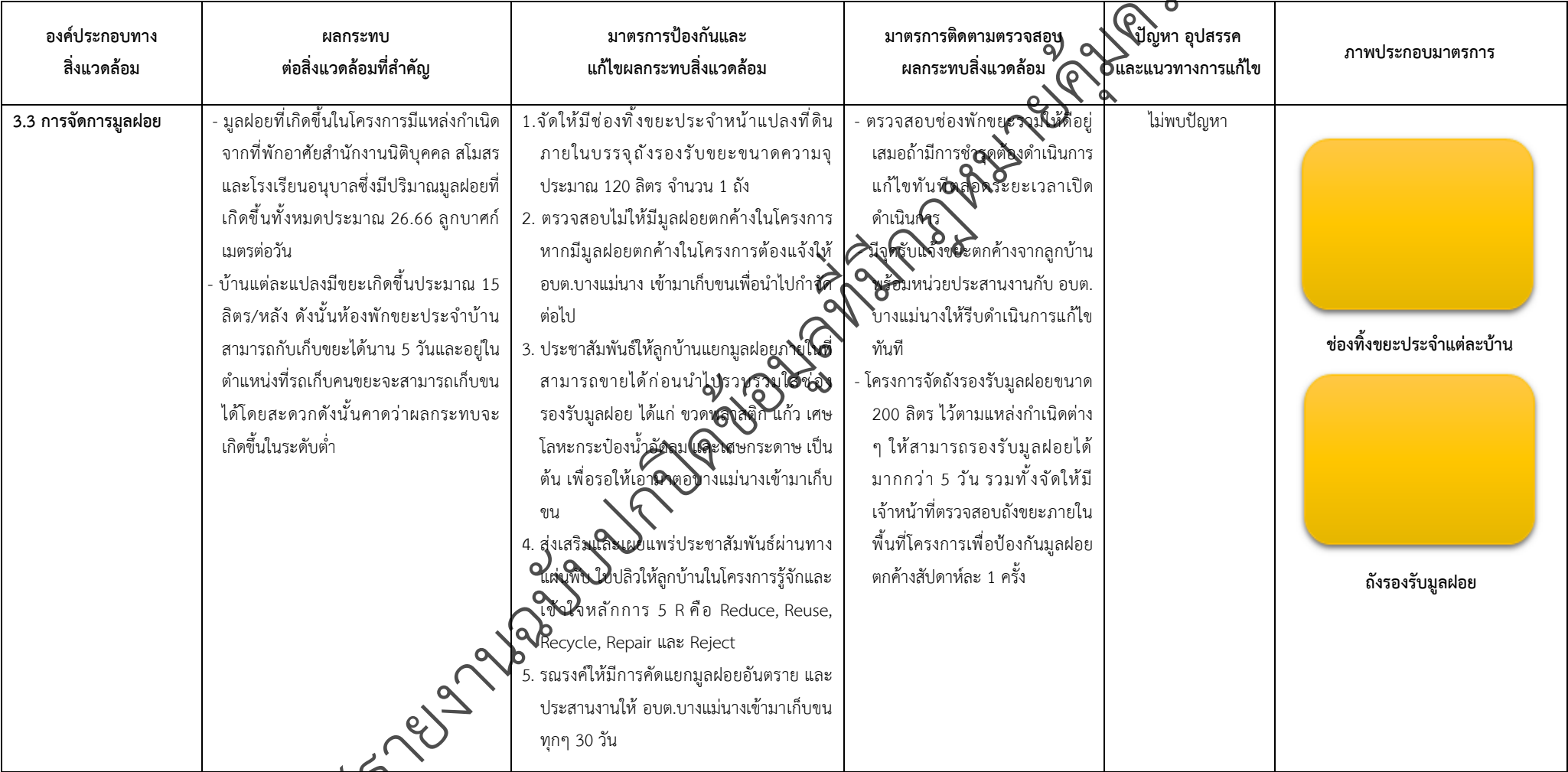
ตารางที่ 2-1 สรุปผลกระทบสิ่งแวดล้อมที่สำคัญและการปฏิบัติตามมาตรการป้องกันและแก้ไขผลกระทบสิ่งแวดล้อมและมาตรการติดตามตรวจสอบผลกระทบสิ่งแวดล้อม (ระยะดำเนินการ) โครงการจัดสรรที่ดิน เพอร์เฟค พาร์ค พระราม 5 - บางใหญ่ (โครงการต่อเนื่องในอนาคต) ตั้งอยู่ที่ ตำบลบางแม่นาง อำเภอนาเกลือ จังหวัดนนทบุรี (ต่อ)