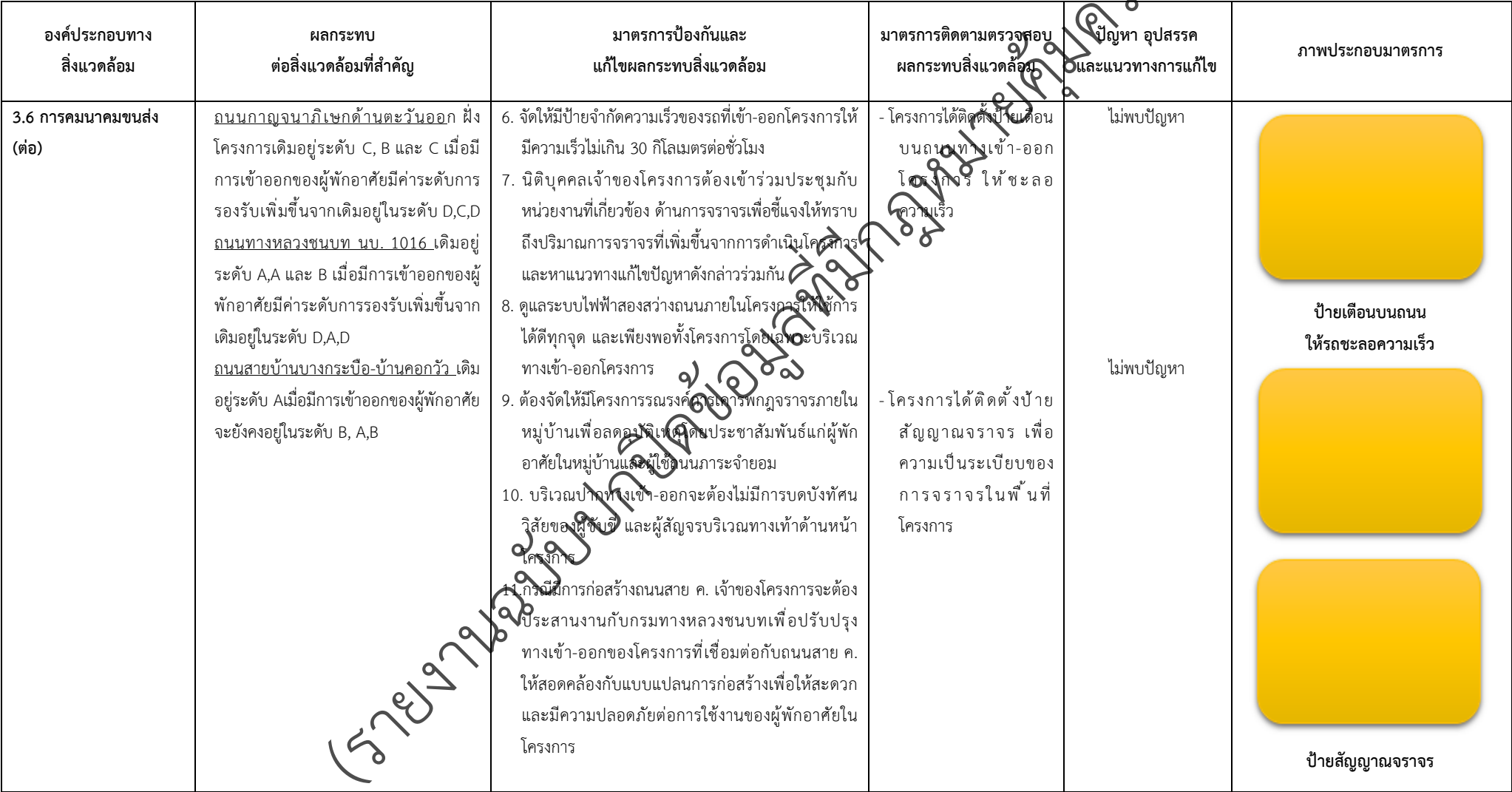
ตารางที่ 2-1 สรุปผลกระทบสิ่งแวดล้อมที่สำคัญและการปฏิบัติตามมาตรการป้องกันและแก้ไขผลกระทบสิ่งแวดล้อมและมาตรการติดตามตรวจสอบผลกระทบสิ่งแวดล้อม (ระยะดำเนินการ) โครงการจัดสรรที่ดิน เพอร์เฟค พาร์ค พระราม 5 - บางใหญ่ (โครงการต่อเนื่องในอนาคต) ตั้งอยู่ที่ ตำบลบางแม่นาง อำเภอนางใหญ่ จังหวัดนนทบุรี (ต่อ)