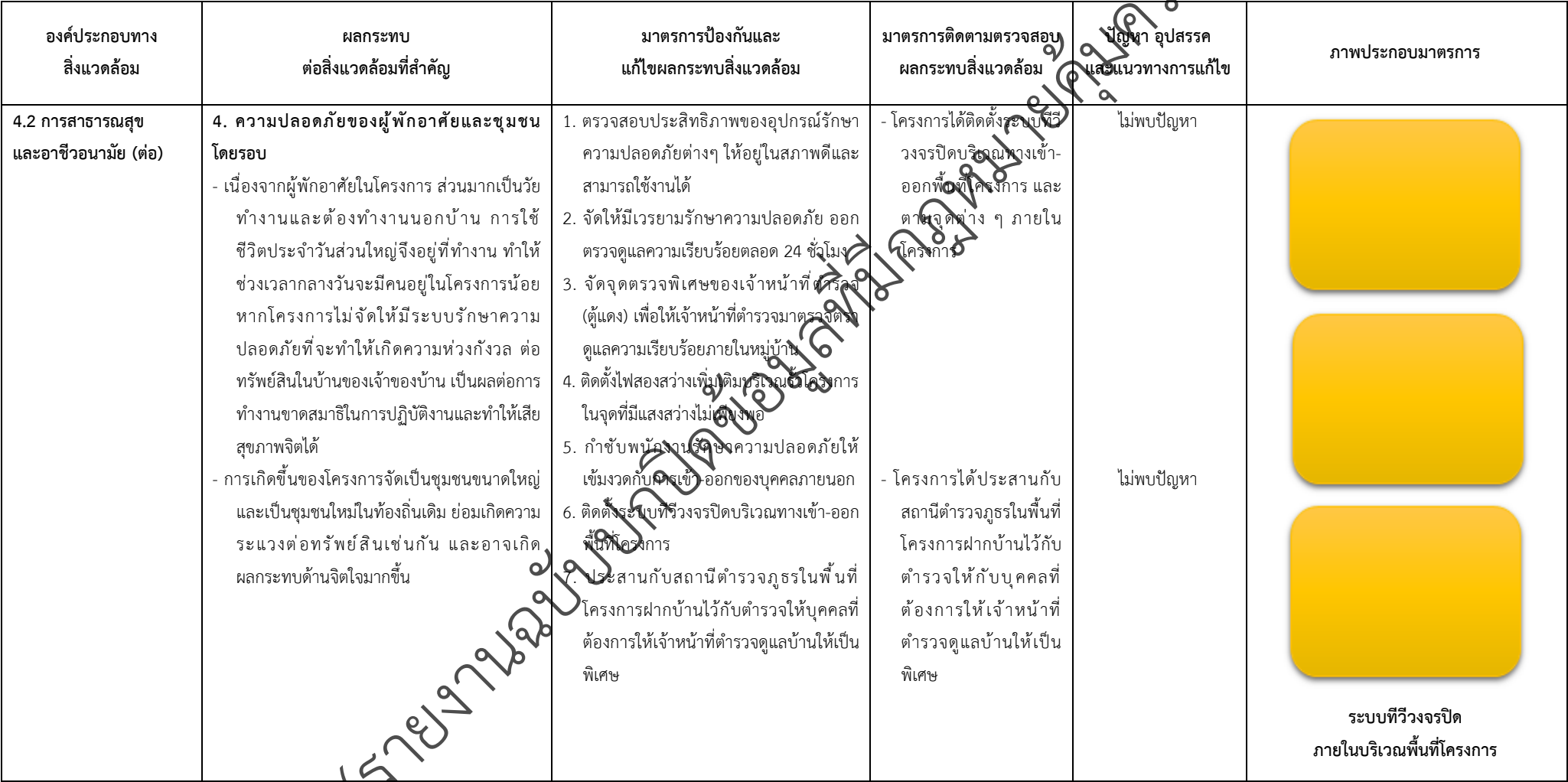
ตารางที่ 2-1 สรุปผลกระทบสิ่งแวดล้อมที่สำคัญและการปฏิบัติตามมาตรการป้องกันและแก้ไขผลกระทบสิ่งแวดล้อมและมาตรการติดตามตรวจสอบผลกระทบสิ่งแวดล้อม (ระยะดำเนินการ) โครงการจัดสรรที่ดิน เพอร์เฟค พาร์ค พระราม 5 - บางใหญ่ (โครงการต่อเนื่องในอนาคต) ตั้งอยู่ที่ ตำบลบางแม่นาง อำเภอนางใหญ่ จังหวัดนนทบุรี (ต่อ)